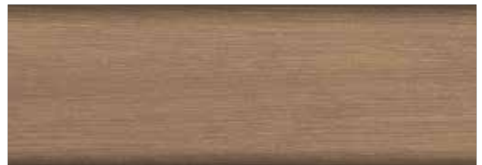
szary toskański nr art. 2267 • FT 20925*