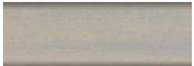
szary okienny nr art. 2267 • FT 20931*