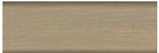
glina nr art. 2267 • FT 20926*