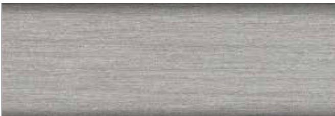
platynowy nr art. 2291