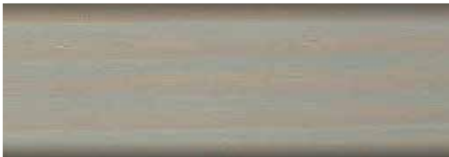
srebrnoszary nr art. 2257