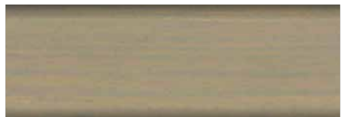
piaskowoszary nr art. 2267 • FT 20927*