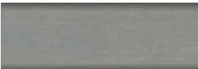
szary wodny nr art. 2294