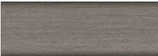
grafitowy nr art. 2265