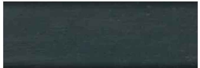
granitowy nr art. 2267 • FT 20923*